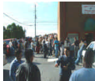
En la gráfica, personas a la espera de atención en Norcross.

Finalmente, el Consulado General de El Salvador en Miami Florida, desea hacer público su enorme agradecimiento a Wester Union ya que ha mostrado un invaluable apoyo para la difusión de los Consulados Móviles organizados por éste Consulado General.