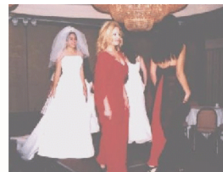
Gráfica del 1er Fashion Show