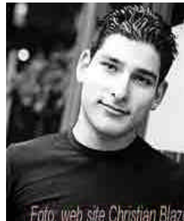
Christian Blaze

Si desea ver la entrevista completa visite el vínculo: http://www.clic.org.sv/noti_plantilla.php?idnota=190