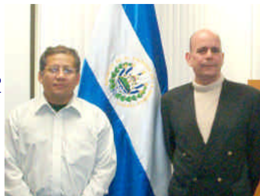
De izq. a der.: Escritor Baldor y Cónsul Herodier