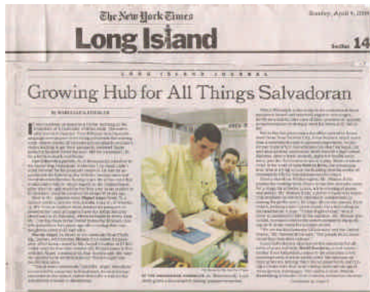
Vista del artículo publicado el 04 de abril en el prestigioso periódico The New York Times

formación de una Alianza Salvadoreña Americana , que es una organización de presidentes de grupos salvadoreños de los Condados de Nassau y Suffolk, incluyendo la Cámara Salvadoreña Americana de Comercio , Comités Cívicos Salvadoreños y salvadoreño-americanos residentes en Long Island que trabajan en ayudar a los salvadoreños inmigrantes en cuestiones legales, impuestos y consejería para la obtención o alquiler de viviendas.